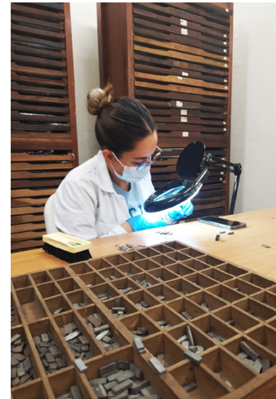
Catalogación de las piezas de la "Imprenta Sibaja" en el Museo Juan Santamaría