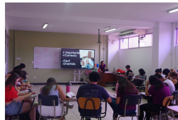
Presentación a estudiantes sobre el Programa de Liderazgo de la SIUA