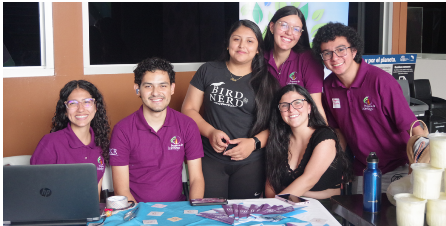
Estudiantes del Programa de Liderazgo de la SIUA