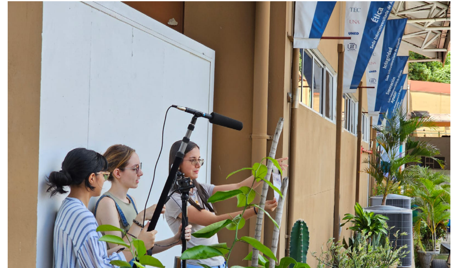
Estudiantes de la SIA participaron en el taller de producción de video.