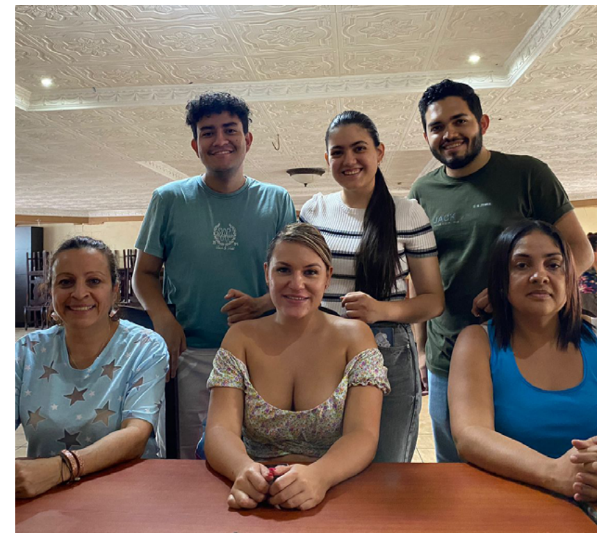
Clases presenciales de dibujo y pintura, estudiantes y participantes de la comunidad.

Entre las actividades realizadas por el TC-729 en el mes de mayo, se destaca la continua visita de estudiantes a cargo del embellecimiento de los salones comunales de Villa Hermosa y Cerrillal, mediante la confección de los diferentes murales. También en ambas localidades se continúa con la investigación social y entrevista con las diferentes comunidades aledañas.