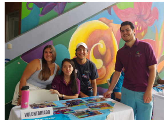
Estudiantes del Grupo de Voluntariado y del Programa de Liderazgo de la SIUA