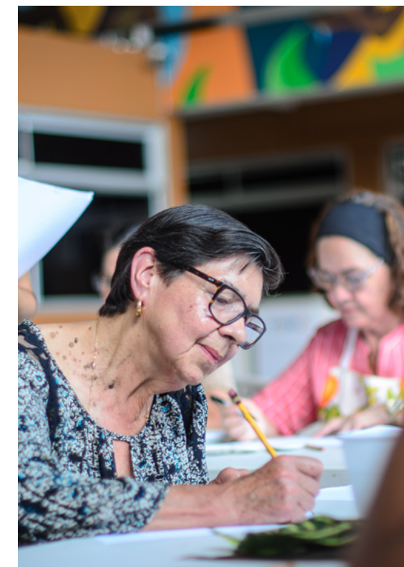
Los asistentes al taller de Estampado en Textil, fueron en su mayoría adultos mayores de la comunidad.

Los talleres se impartieron en los meses de mayo y junio, coordinados en 4 ejes temáticos muy diversos como: Dibujo de Caricatura, Estampado en Textil, Producción de Video con Celular, entre otros. Para la asistencia a esta oferta de talleres, se atendió una amplia población que va desde la niñez hasta la población adulta mayor, para un total de 45 personas del Cantón Central de Alajuela, distribuidas entre todos los talleres.