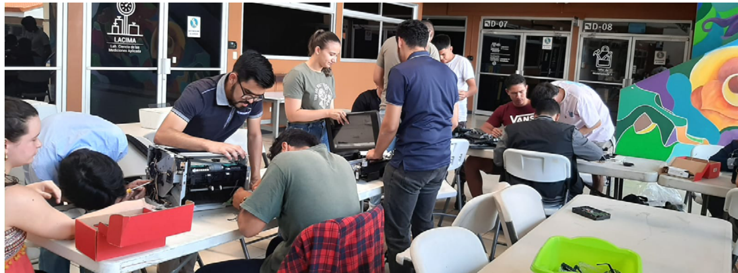
La segunda parte del taller concluyó el pasado 27 de junio, nuevamente con la organización previa de equipos mixtos de trabajo como representación de las tres diferentes carreras de la UCR.