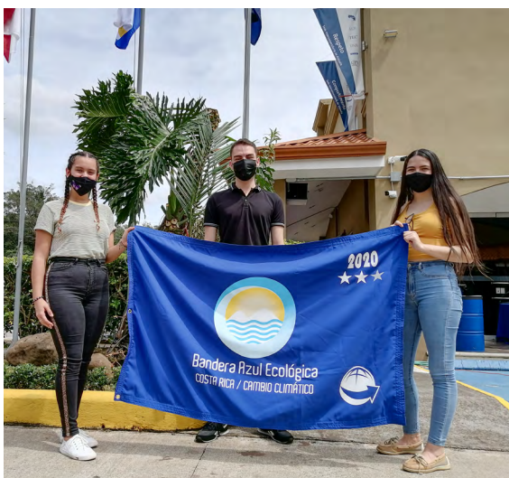
Representación estudiantil de la Sede Interuniversitaria de Alajuela.