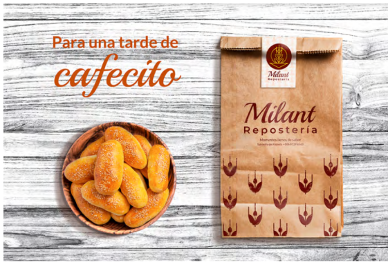
Propuesta de marca realizada por la estudiante Valeria Montero para empresa "Milant Repostería".