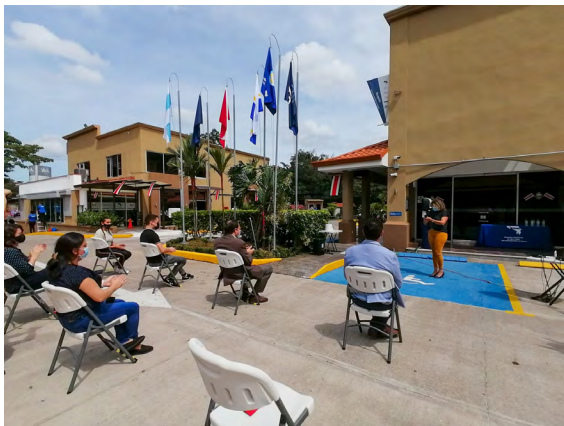
Acto de Izamiento Bandera Azul, 10 de Septiembre 2021