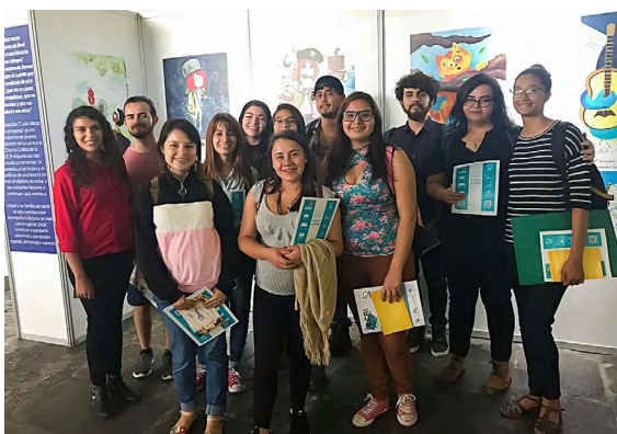
Estudiantes en la exposición de carteles Proyecto Ampliado: Feria del Libro 2019